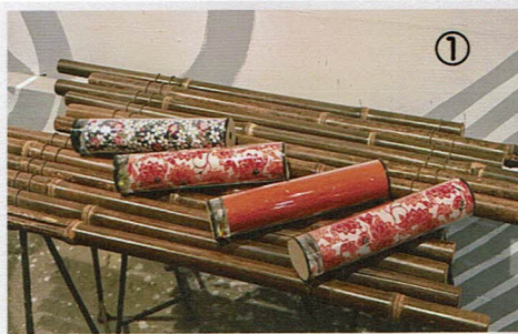
① プロ仕様の画像・アクリル万華鏡 6,480円税込み。いちばん人気!