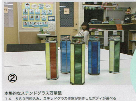
② 本格的なスタンドグラス万華鏡 14,580円税込み。スタンドグラス作家が制作したボディが選べる